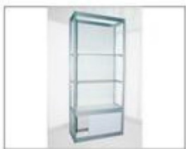
F2 展柜 (玻璃层板) L990×W495×H2000