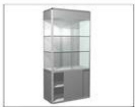
F5 玻璃高柜 (不含灯具) L990×W495×H2000