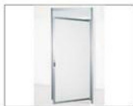
F16 铝合金门 L1000×H2400