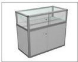
F10 玻璃矮饰柜 (不含灯具) L990×W495×H1000