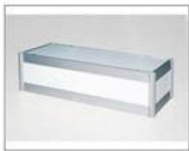
F11 展台 L990×W495×H300