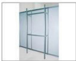
F7 挂架 L990×W495×H2480