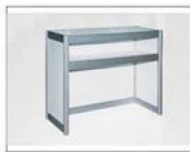
F8 报到台 L990×W495×H1000