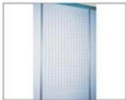
F18 网片 (需自备挂钩) L1000×H1500