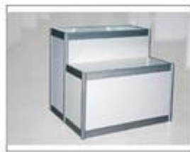
F12 高低展柜 (A) L990×W495/495×H1000/750