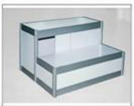
F13 高低展柜 (B) L990×W495/495×H750/300