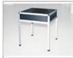
F22 铝合金方台 L650×W650×H680