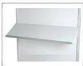
F15 斜搁板 L990×W310