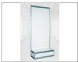
F6 前言牌 L990×H2480