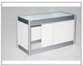
F9 地柜 (配锁) L990×W495×H750