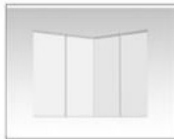
F19 展板 L990×H2480