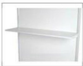
F14 平搁板 L990×W310