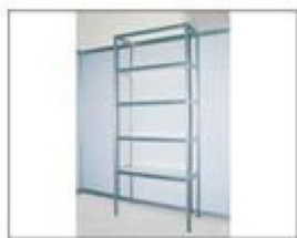
F4 展架 (玻璃层板) L990×W495×H2500