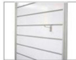
F20 槽板 (需自备挂钩) L1000×H2400