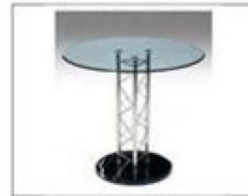
F23 玻璃圆台 R400×H800