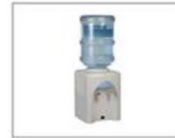
F28 饮水机 展会期间含配一桶水