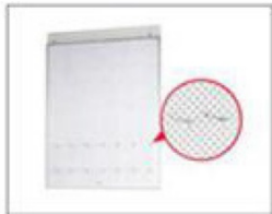
F21 洞洞板 (需自备挂钩) L968×H1188, 洞距 (mm)