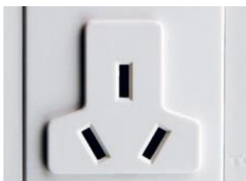
5 安培 / 220 伏特