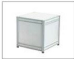
F17 小展示台 L495×W495×H500