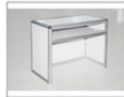
F24 铝合金咨询台 L950×W450×H760