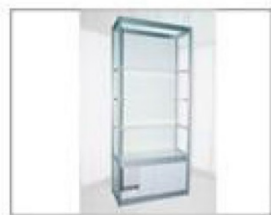
F1 展柜 (木层板) L990×W495×H2000