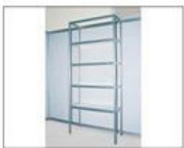
F3 展架 (木层板) L990×W495×H2500